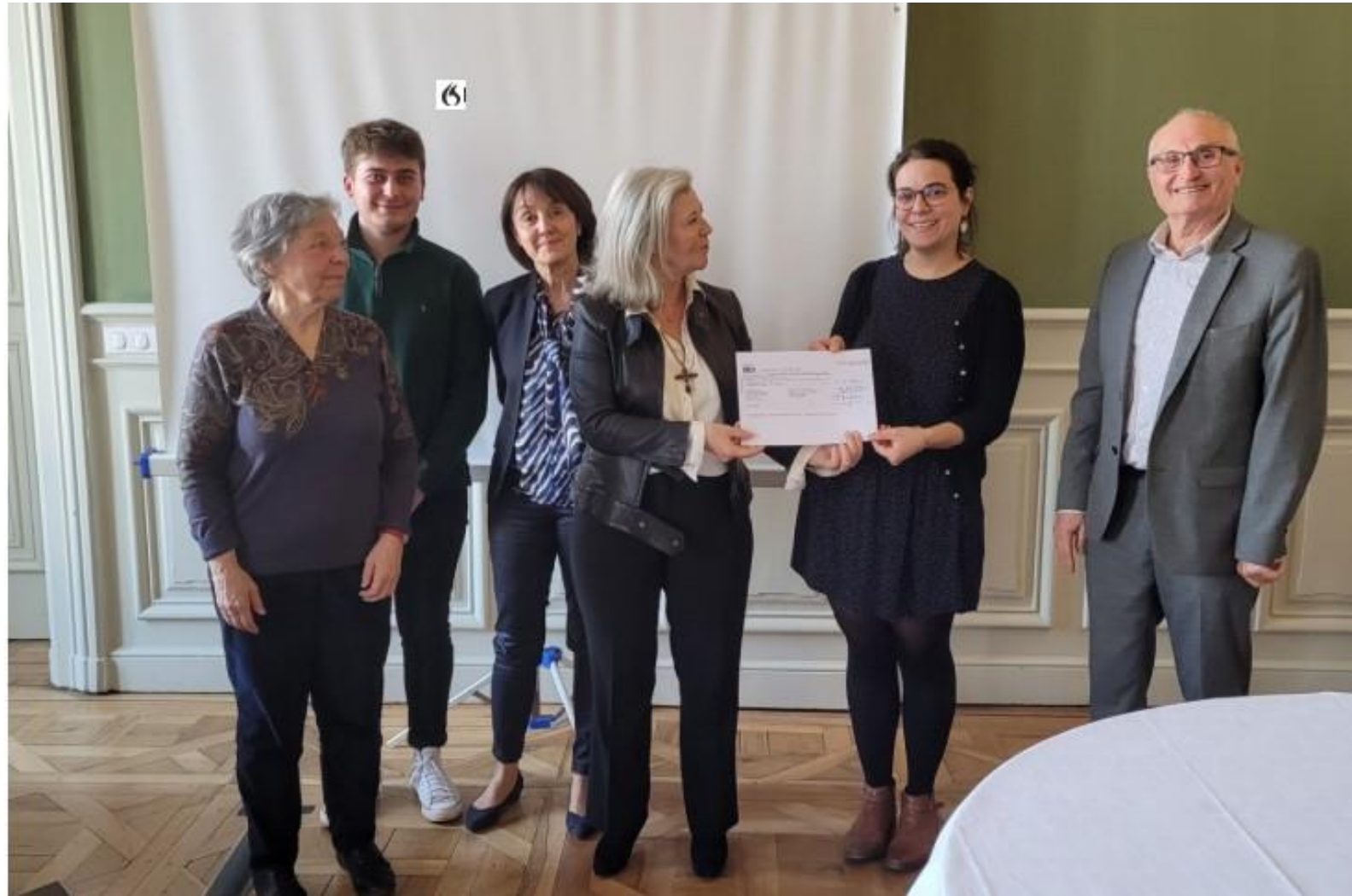
Leg Odile Foucault (Mme Prouvoyeur) GESTION DE NOS LEGS (Fonds de dotation, Bernard Colombaud)